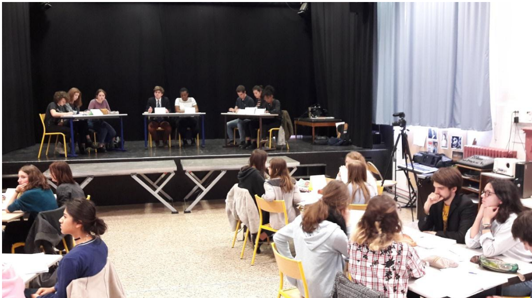
Sur l'estrade, au centre le président de séance et le maître du temps. De part et d'autre les 3 députés partisans et les 3 députés opposants. Au bas de l'estrade les commissions parlementaires.