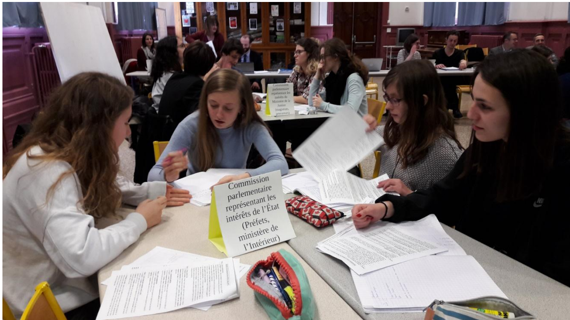
La commission parlementaire représentant les intérêts de l'Etat au travail

Les membres de chaque commission se définissent un slogan qu'ils utiliseront au cours du débat pour manifester leur soutien à leur camp et listent deux arguments majeurs qui justifient leur soutien ou leur opposition au projet de loi. Les membres de la commission désignent en interne un Président . Il sera le rapporteur chargé de justifier auprès de toute l'assemblée, la position initiale de sa commission, les deux arguments majeurs qui la fondent et le slogan pour les identifier